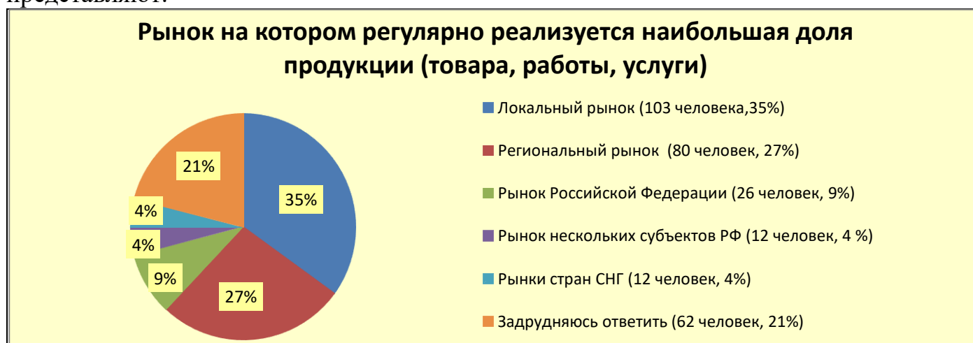
Рис. 1 - Географический рынок, который является основным для ведения бизнеса

Далее респонденты ответили, какой географический рынок региона они представляют.